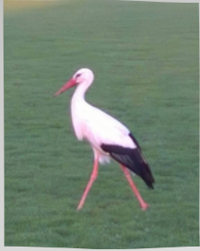
Mars - Une cigogne annonce le printemps sur notre terrain de foot