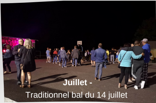
Juillet - Traditionnel bal du 14 juillet Fête de St-Loup - brocante