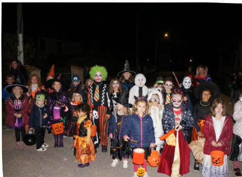
Octobre - Les vampires et sorcières ont répondu présents(es) à la soirée d'Halloween