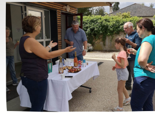
Juin - Désherbage des massifs. Les bénévoles y ont mis beaucoup d'entrain. Et après l'effort, le réconfort !