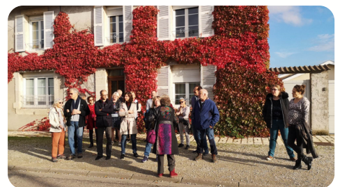
Octobre - Découverte du village Journées du patrimoine.