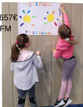
Téléthon - 2657€ remis à l'AFM