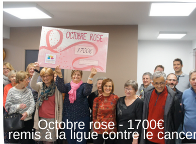
Octobre rose - 1700€ remis à la ligue contre le cancer