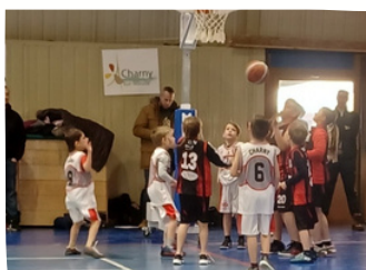
Décembre Tournoi de Noël à l'ASC Venue de Saint-Nicolas à BRAS