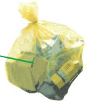
un côté pour les sacs jaunes