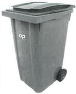
un côté pour les ordures ménagères

Équipement sur tout le secteur de benne « Sélecta »